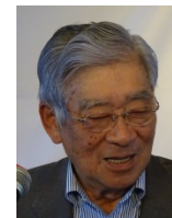
中尾特別代表より 一言