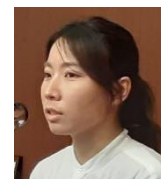
伊林侑香監督より 新作映画についてご挨拶