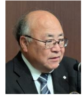
河上会員 村田会員 皆出席表彰おめでとうございます